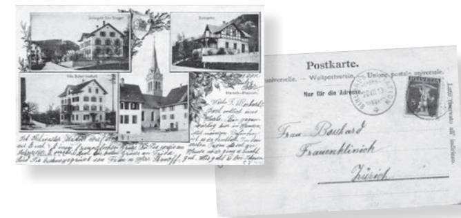
Beispiel einer im Sekretär gefundenen Ansichtskarte von 1910