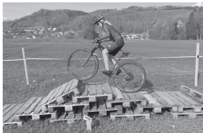
Jedes Hindernis ist mit einer Tafel mit Instruktionen ausgestattet.

Viele Mountainbiker haben keine oder nur eine ungenügende Technik. Das führt dazu, dass das Bike in vielen Situationen nicht beherrscht und durch falsche Handlungen die Sturzgefahr erhöht wird. Wie viele Skifahrer kennen sie, die das 1x1 auf der Piste in einer Skischule gelernt haben? Wohl die Mehrheit. Auf dem Mountainbike ist das gerade umgekehrt. Und hier will der Mountainbike Club Oberamt ansetzen. Durch die Verbesserung der Fahrtechnik soll die Anzahl Unfälle minimiert werden.